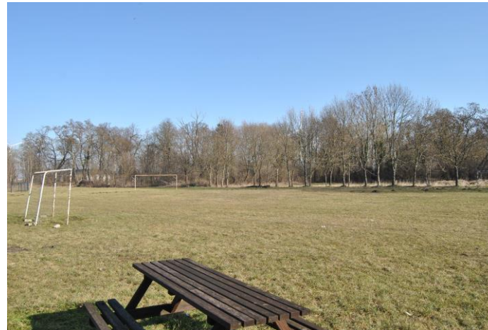
Teren zielony przy świetlicy wiejskiej