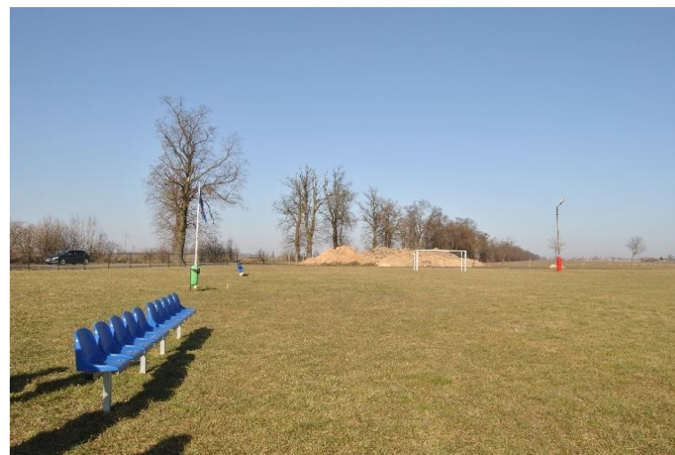
Boisko sportowe w Rokosowie.