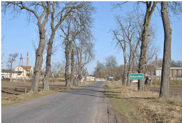
Wjazd do miejscowości z widoczną tablicą.