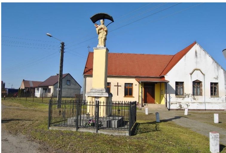
Kaplica pw. bł. Karoliny Kózkówny oraz figura św. Wawrzyńca.