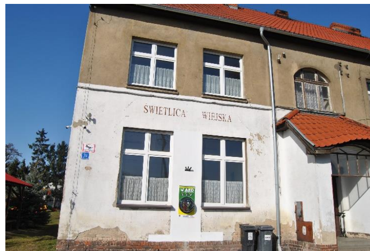
Świetlica wiejska w Rokosowie.