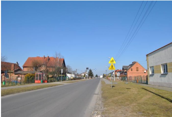
Świetlica wiejska oraz przedszkole w tle