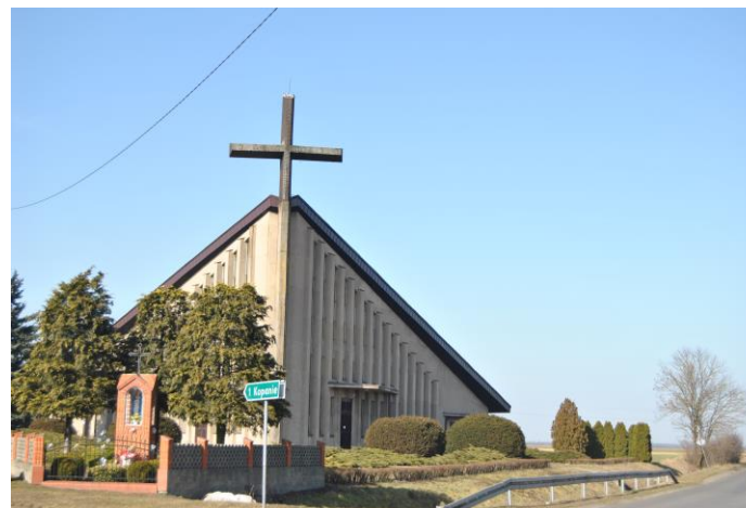
Kościół oraz kapliczka