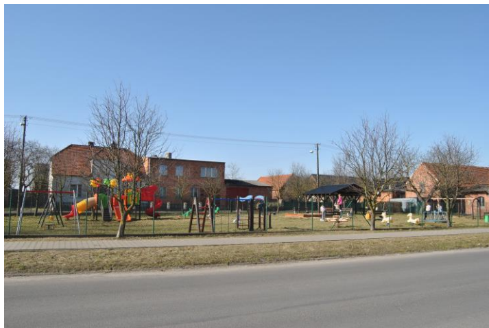
Plac zabaw przy przedszkolu