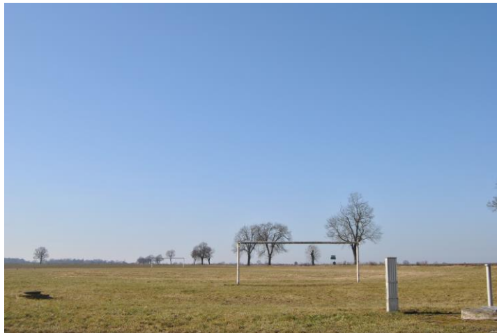
Teren zielony pod kompleks sportowy