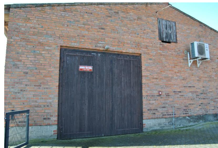
Ochotnicza Straż Pożarna w Łęce Małej.