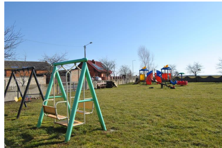
Plac zabaw i teren rekreacyjny obok świetlicy.