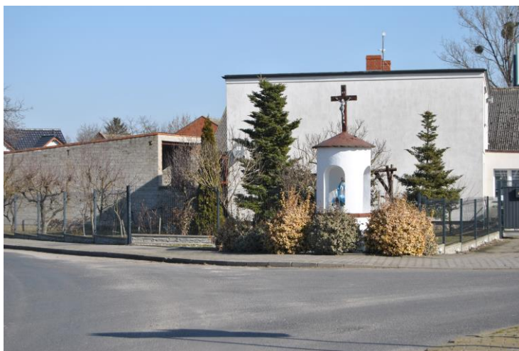
Skrzyżowanie dróg w centrum wsi oraz jedna z przydrożnych kapliczek.