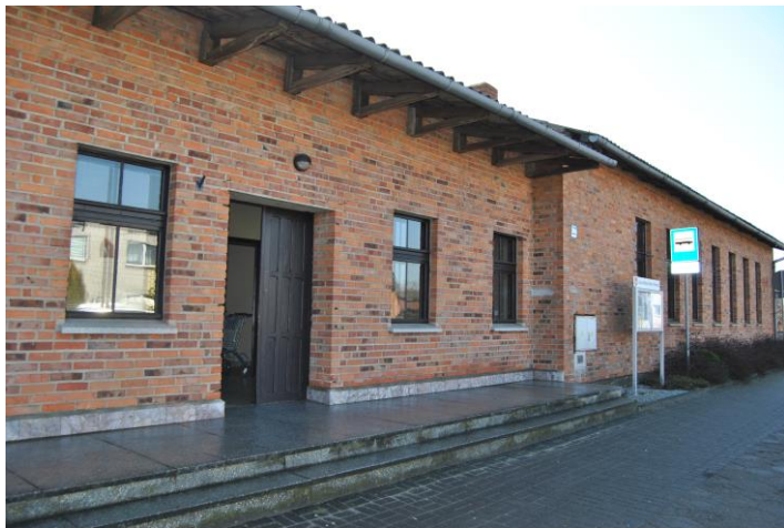
Świetlica wiejska w Łęce Małej wraz z przystankiem autobusowym.